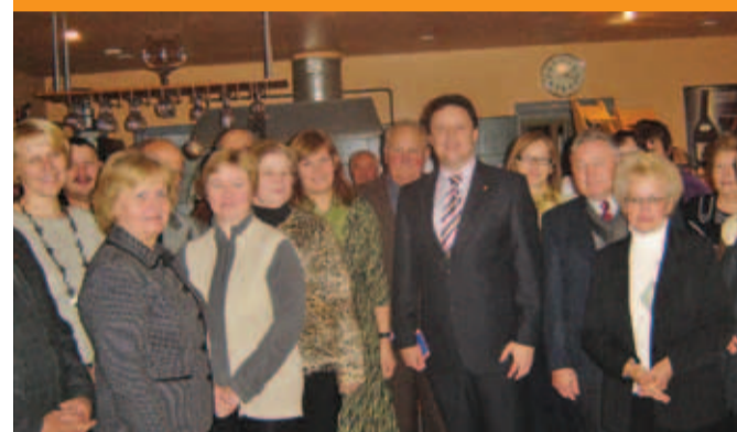
Seimo narys A. Melianas su Pavilnio bendruomene

Pažymint Pasaulinę pagyvenusių žmonių dieną, Seimo narys Artūras Melianas kartu su vietos bendruomenėmis Pavilnyje, Dvarčionyse, Naujojoje Vilnioje ir Naujininkuose organizavo jau tradicija Vilniuje tapusią akciją Senjorams „Susitikime prie kavos puodelio“.